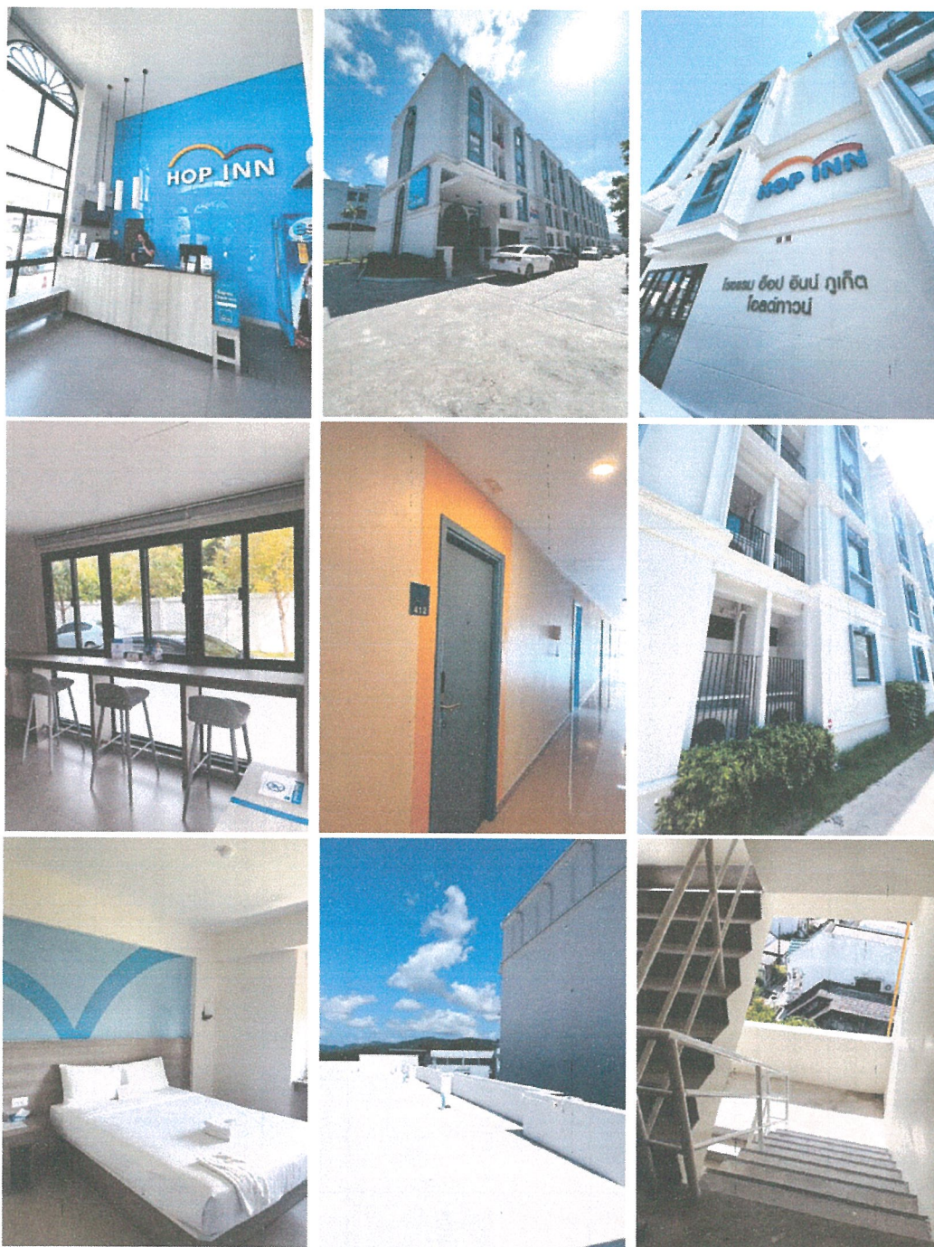
รูปภาพที่ 1.4 การใช้พื้นที่ของโครงการ

ระยะดำเนินการ ระหว่างเดือน มกราคม – มิถุนายน 2566